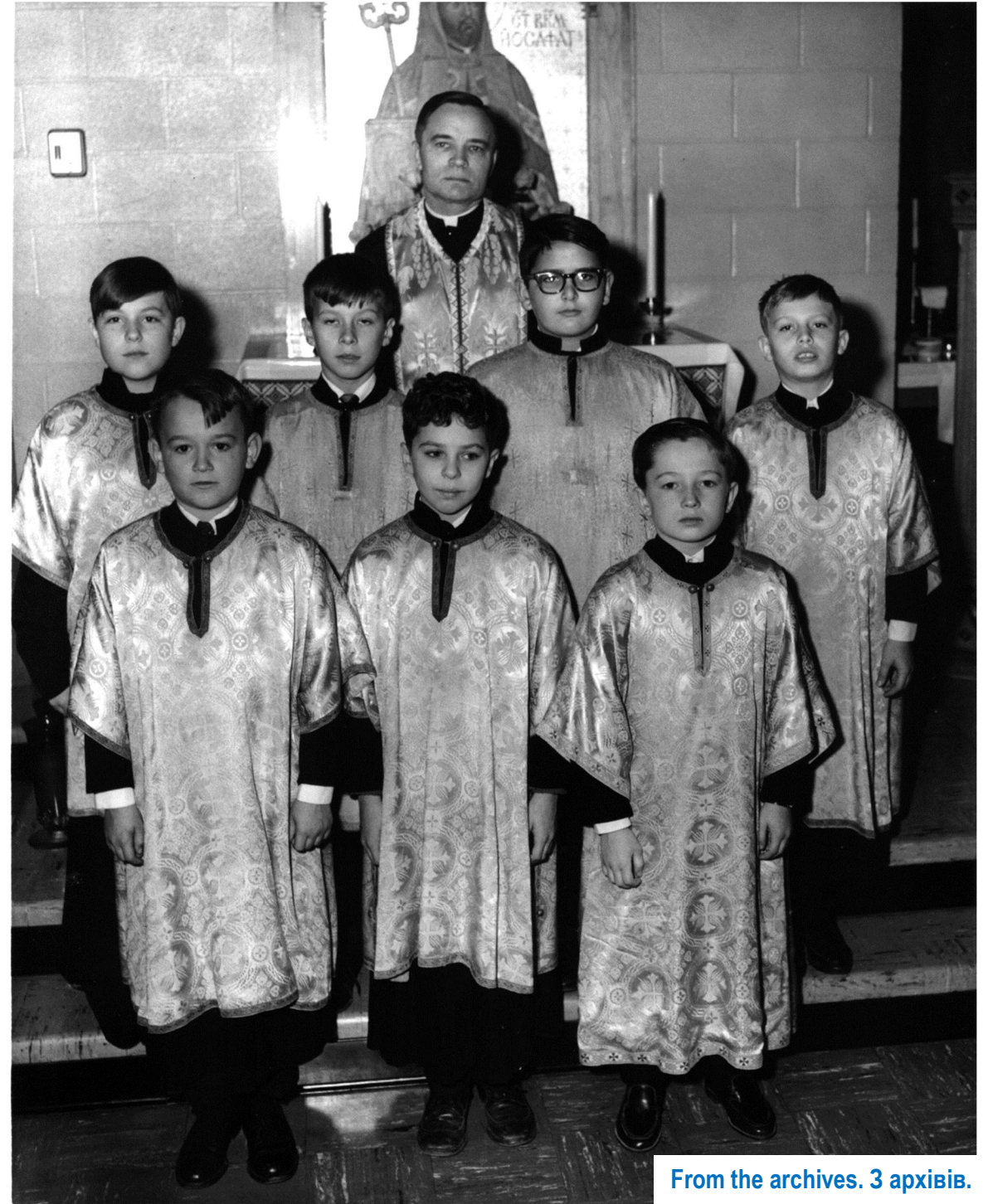
From the archives. 3 apxibiv.