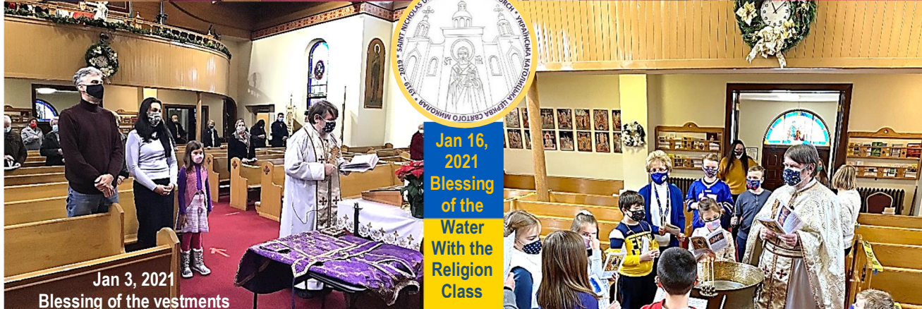
Jan 3, 2021 Blessing of the vestments