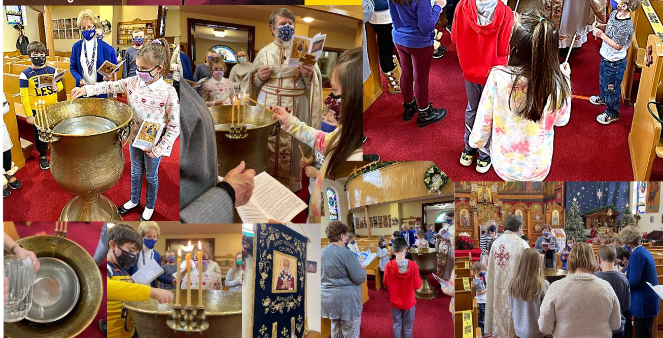
Jan 16, 2021 Blessing of the Water With the Religion Class