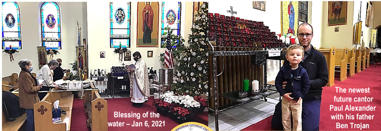
Blessing of the water – Jan 6, 2021

January 24 – 2021 – 24 січня ЦЕРКОВНИЙ ВІСНИК