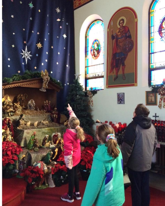
Children's Water Blessing January 18, 2020