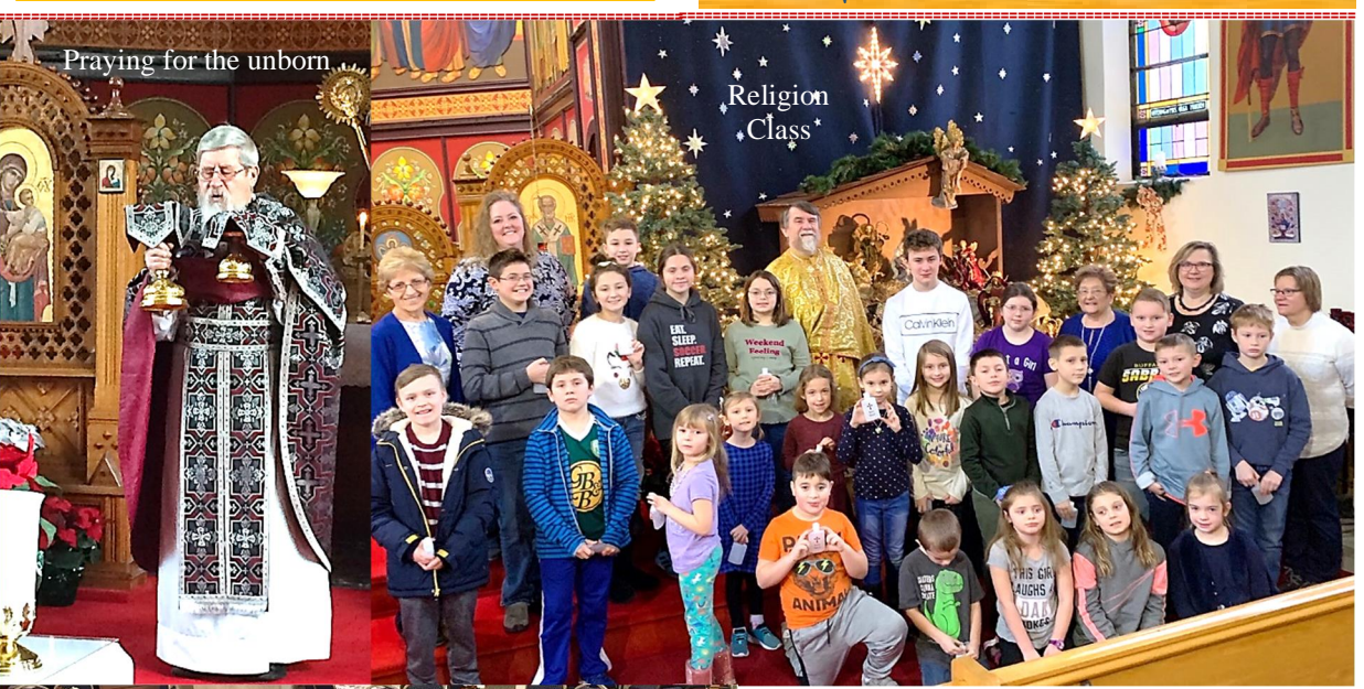
Praying for the unborn