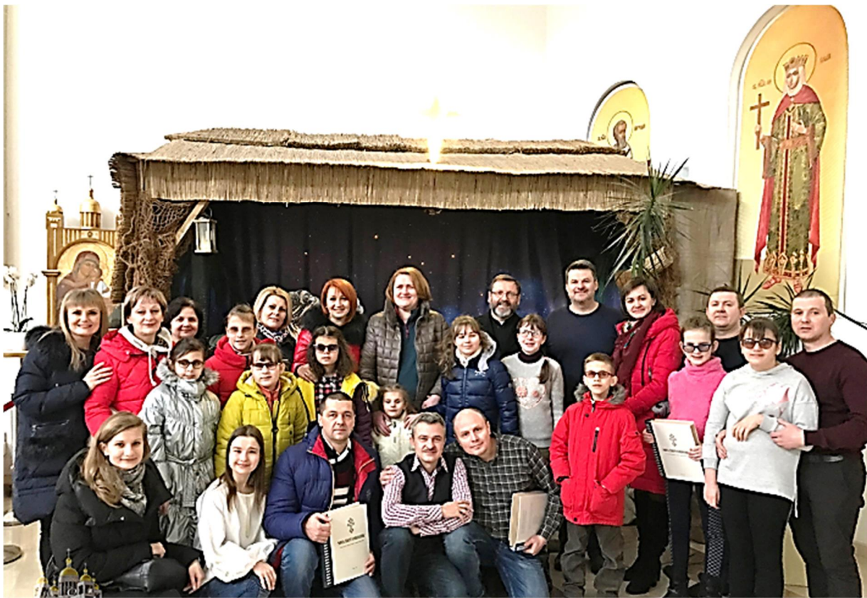
Главі УГКЦ заклали незрячі діти та солісти «Пікардійської терції» (Департамент інформації УГКЦ)

До Отця і Глави Української Греко-Католицької Церкви Блаженнішого Святослава у Патріарший собор Воскресіння Христового прийшли заклади незрячі діти та солісти «Пікардійської терції», які є учасниками різдвяного проєкту «Казка на білих лапах».