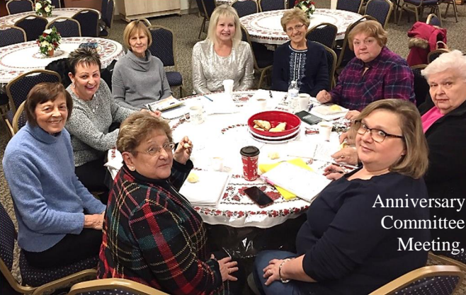
Anniversary Committee Meeting,

Вітаємо Хор «Мрія» сьогодні, що співає під час Літургії і Просфори!