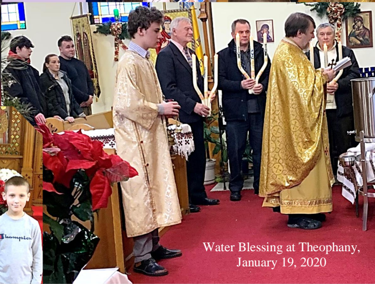
Water Blessing at Theophany, January 19, 2020