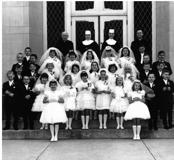
First Communion 1967. There were 32 girls & boys.