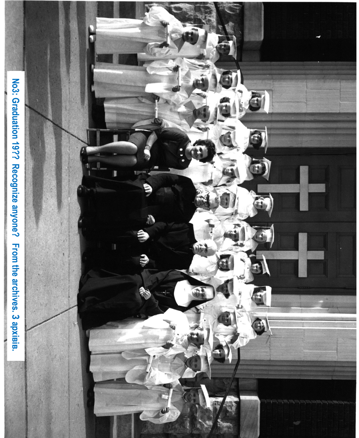
No.3: Graduation 19?? Recognize anyone? From the archives: 3 apxixiib.