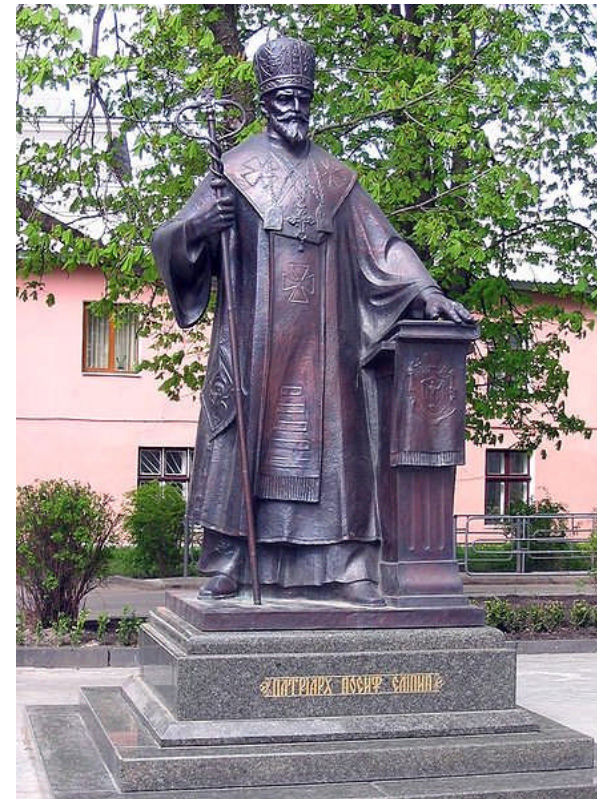
A monument to Patriarch Josef Slipuj in Ternopil Пам'ятник Патріярха Йосифа в Тернополі

УКРАЇНЬСЬКА КАТОЛИЦЬКА ЦЕРКВА СВЯТОГО МИКОЛАЯ