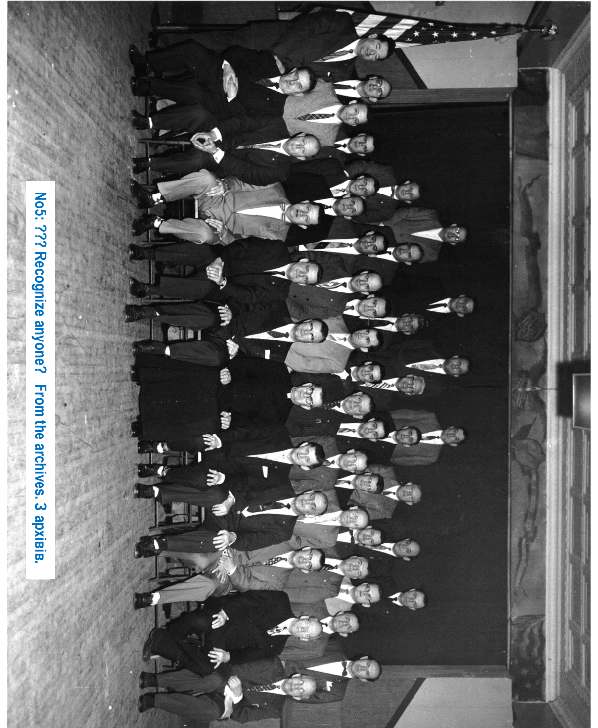
No5: ??? Recognize anyone? From the archives. 3 apxibib.