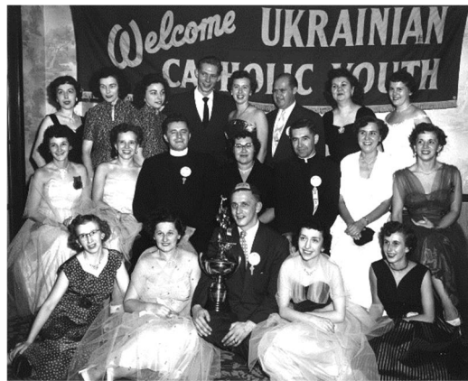
League of Ukrainian Catholic Youth 19. ...?