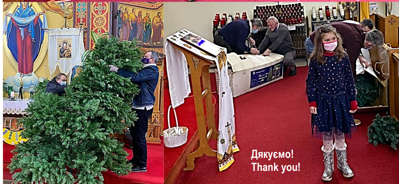
Дякуємо! Thank you!