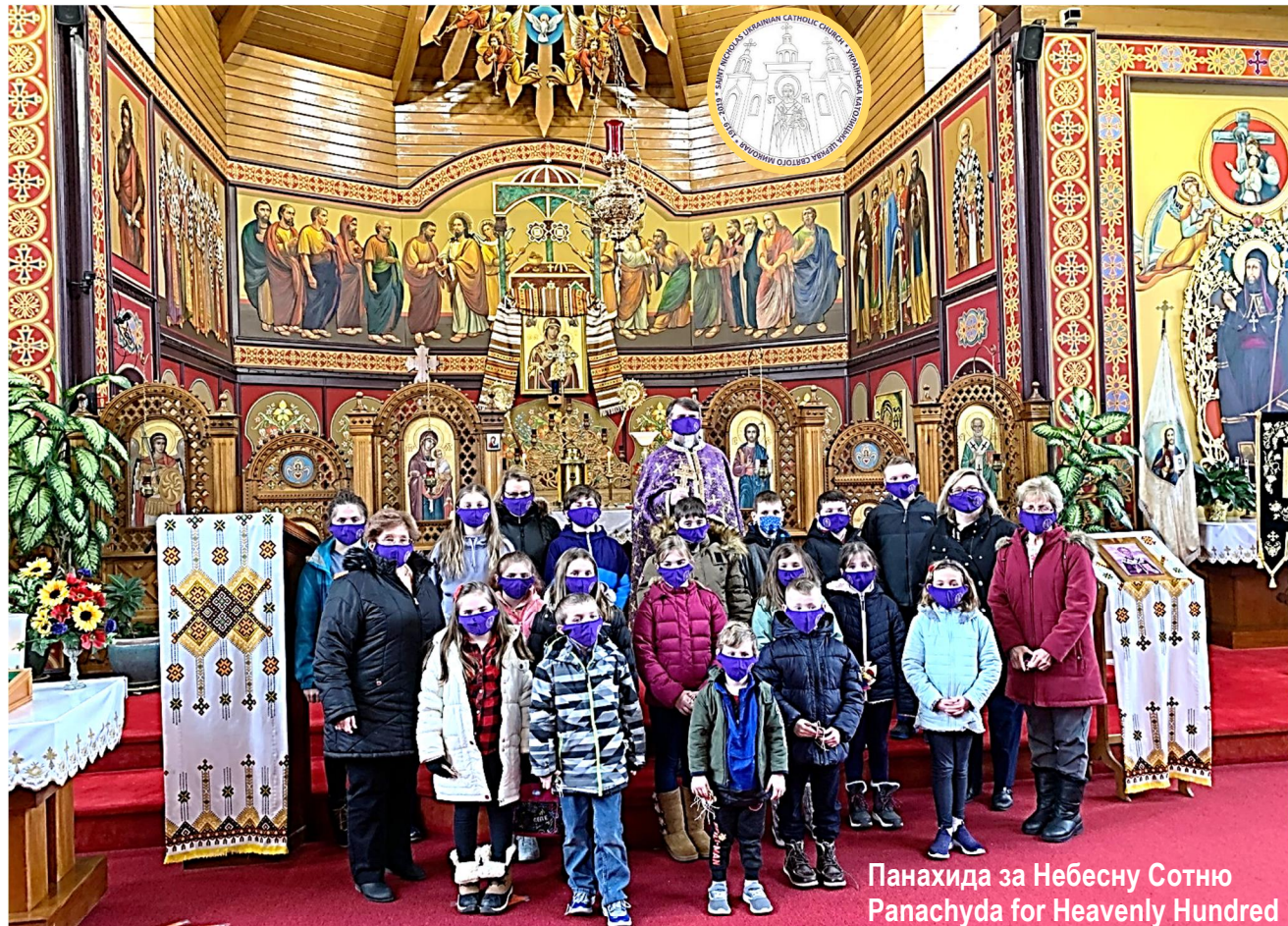
Панахида за Небесну Сотню Panachyda for Heavenly Hundred

February 21 – 2021 – 21 лютого ЦЕРКОВНИЙ ВІСНИК