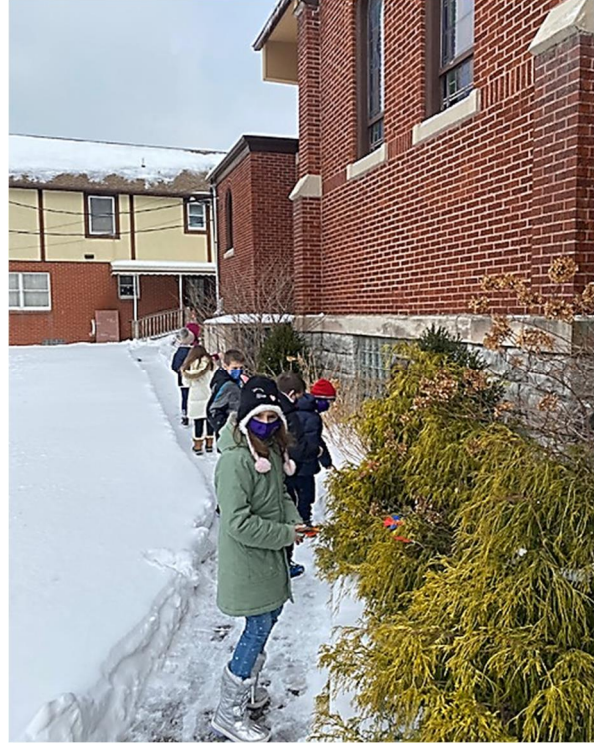
Білі ангели стали кольоровими у руках наших дітей. Тим згадуємо ух загиблих за волю України. The white angels became colored by the hands of our children. With them we remember our heroes.