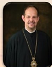
Bishop Bohdan Danylo

Ukrainian Catholic Bishops in the United States of America