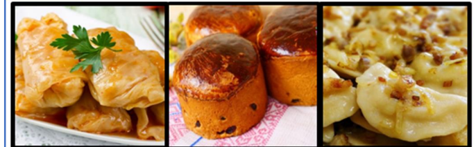
Sponsored by Buffalo Area Ukrainian Churches and Organizations