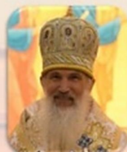
Bishop Benedict Aleksiychuk