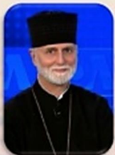
Archbishop Borys Gudziak