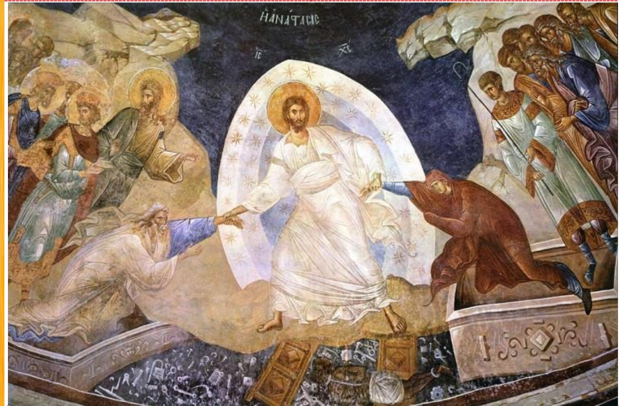
"ANASTASIS" - A 14 th century fresco from the Byzantine era on a wall in the Chora Church in Constantinople (Istanbul, Turkey).

Христос Воскрес! Воістину Воскрес! Christ is Risen! Indeed He is Risen! З нагоди Воскресіння Христового Бажємо усім парохіянам і прихожанам обильних Божих ласк. --- Хай Господь благословить Україну скорою перемогою і подасть тривалий спокій! Have a joyous feast of Resurrection! Happy Easter! May the Lord give Victory to Ukraine!