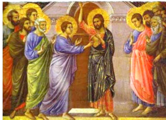
Duccio 1311: Saint Thomas the apostle – Св. Тома

~ Lord, through the prayers of the holy Apostle Thomas, give us faith and help our unbelief! ~ My Lord and My God! – Господь мій і Бог мій!