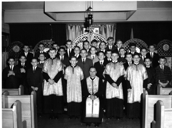
From Last Bulletin: (Photo No. 13)