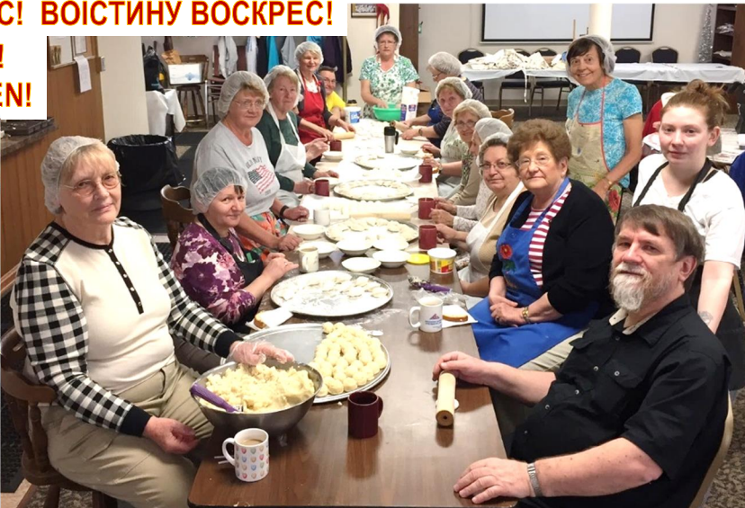
Everyone here came to work in the kitchen. Thank you! Except the one in black – on right.