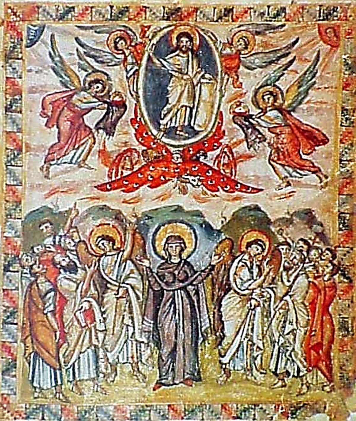
Вознесіння з Євангелії Рабула, 6 ст.

SAINT NICHOLAS UKRAINIAN CATHOLIC CHURCH