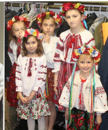
Mother's Day and Easter Dinner – День Матері і Свяченне