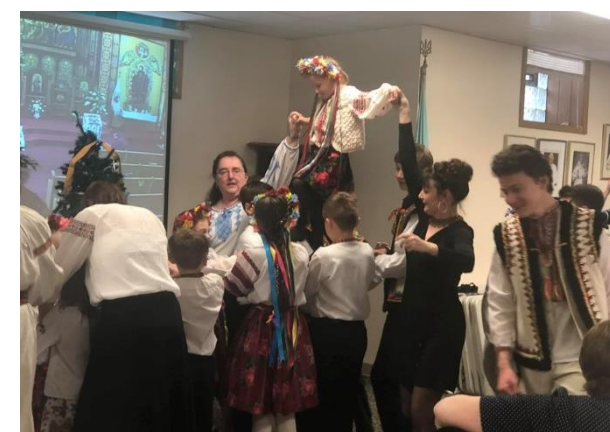
Сердечна подяка всім за участь!