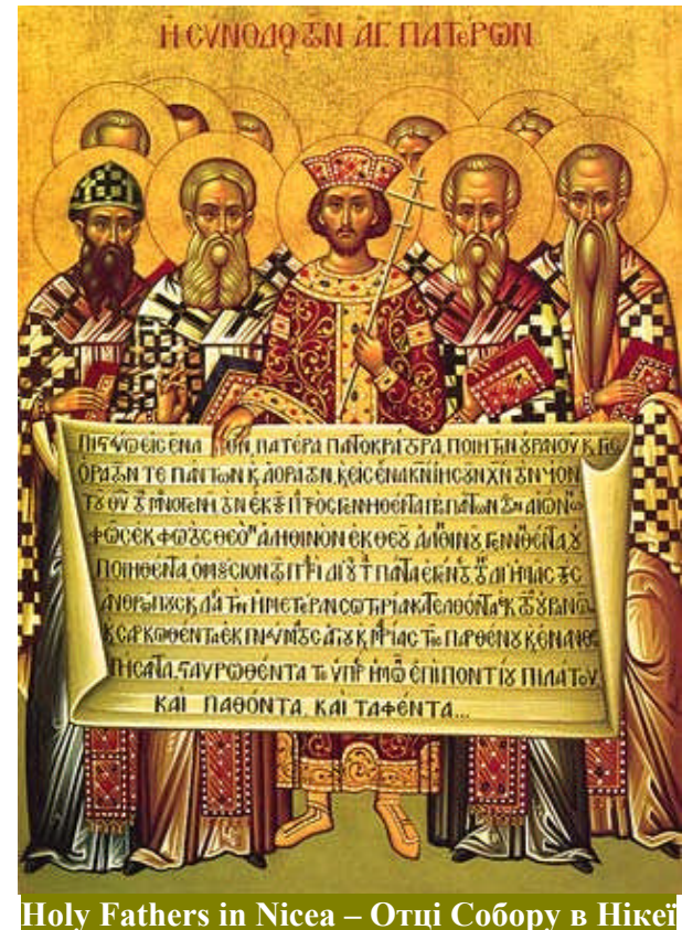
Holy Fathers in Nicea – Отці Собору в Нікеї

June 5 – 2011 – 5 Червня ЦЕРКОВНИЙ ВІСНИК – Ч. 23