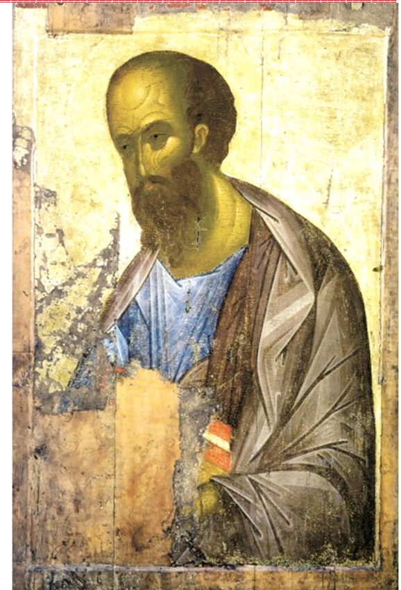
Св Павло зі Звинегородського Деїсусного Чину. (Андрій Рубльов. XV ст.) ← Св. Петро з монастиря Св. Катерини на Си-наю. (Енкаустика. VI ст.)