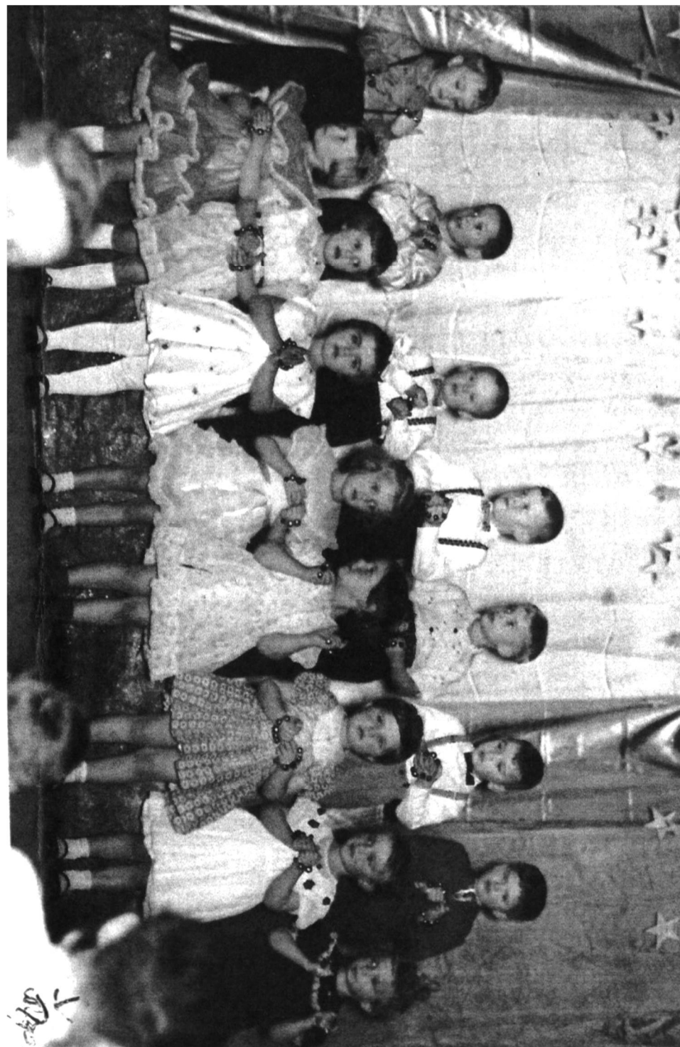
№ 23. From the archives: Anybody you know? З архівів.