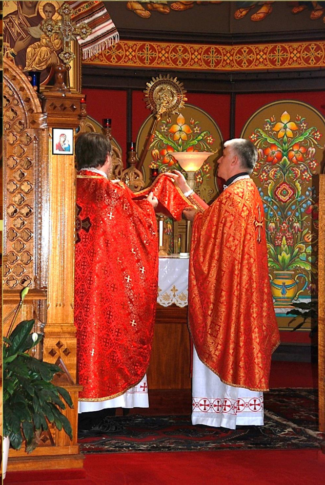
St. John the Baptist, Kenmore, NY FEASTDAY- June 24, 2014 Празник Св. Івана Хрестителя Кенмор, НЙ. – 24 Червня, 2014