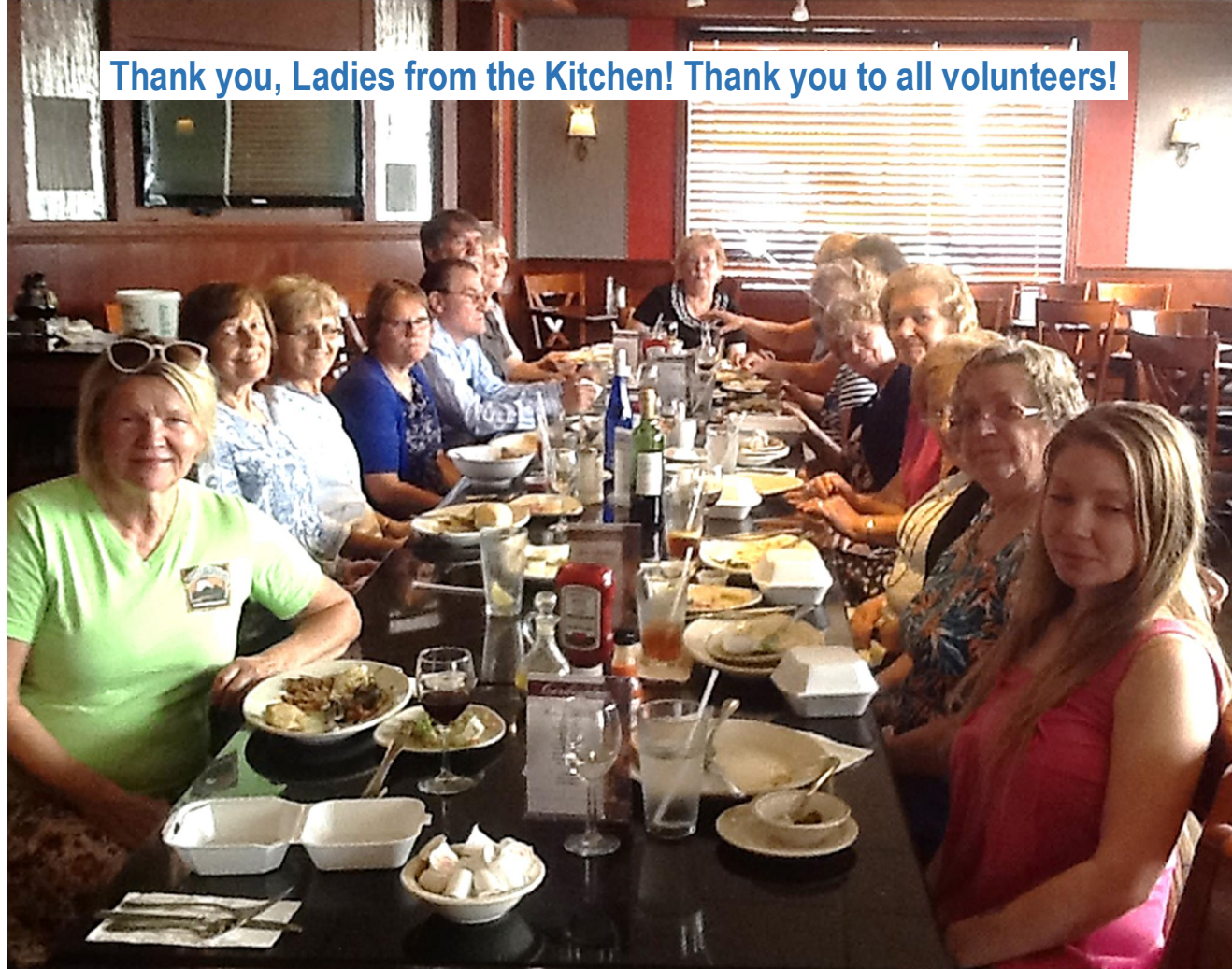
Thank you, Ladies from the Kitchen! Thank you to all volunteers!

SAINT NICHOLAS UKRAINIAN CATHOLIC CHURCH