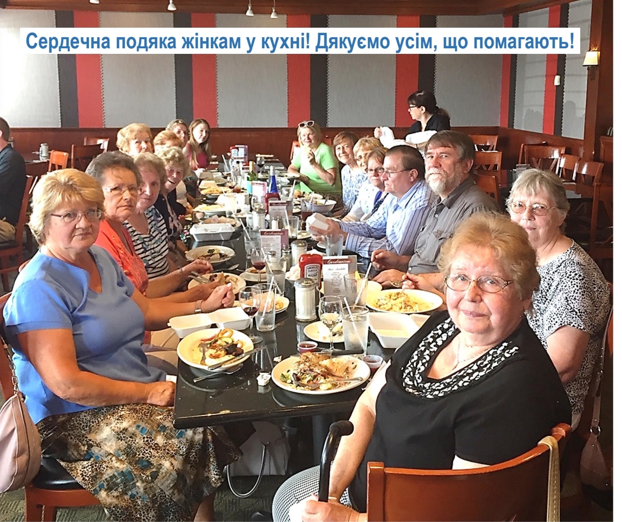
Сердечна подяка жінкам у кухні! Дякуємо усім, що допомагають!