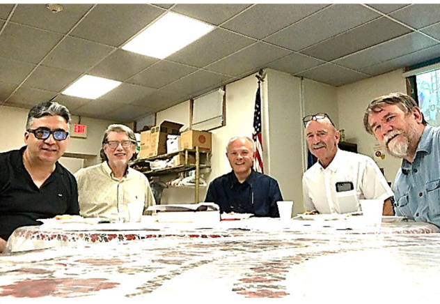
Interfaith Meeting, July 12 at Saint Nicholas ← Hockey for Roswell. 11 Day Power Play.