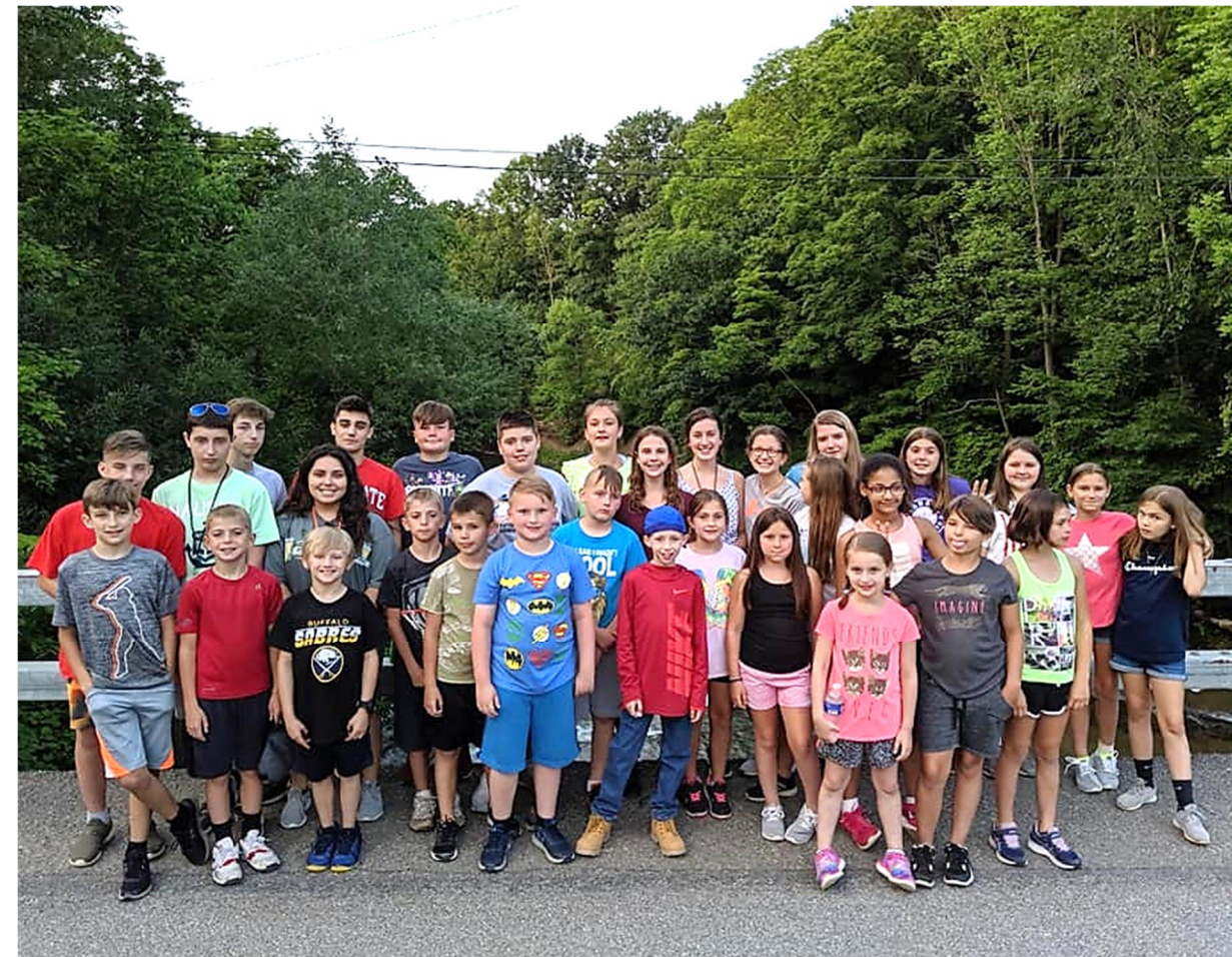
На Сумівській Оселі «Холодний Яр» SUM Camp at Fillmore.