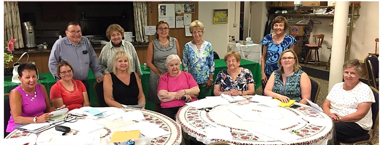
Anniversary Meeting – Ювілейне Засідання At Jazzboline – Відвідини Бенкетової Зали