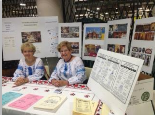
At 125 th Anniversary of Broadway Market