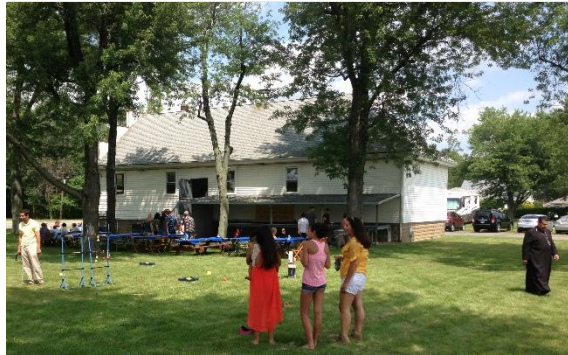
Barbeque Chicken at St. Basil in Lancaster