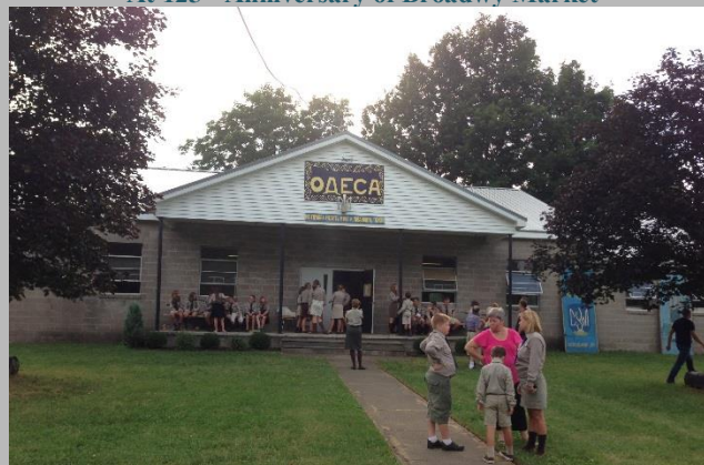
On the SUM Camp in Fillmore, N.Y.