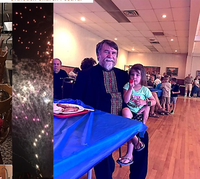
← From the preparation for our church picnic, which takes place today at our church ground. Thank you for your work & support!