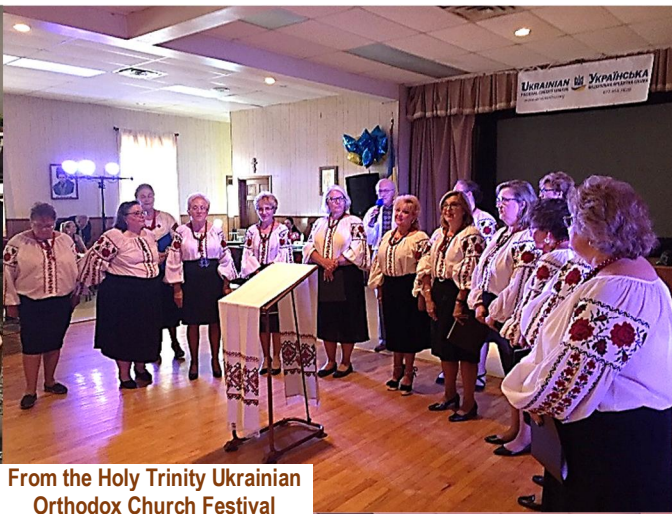
From the Holy Trinity Ukrainian Orthodox Church Festival