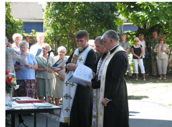
Ukrainian Day – Український День, Дніпро ‘12