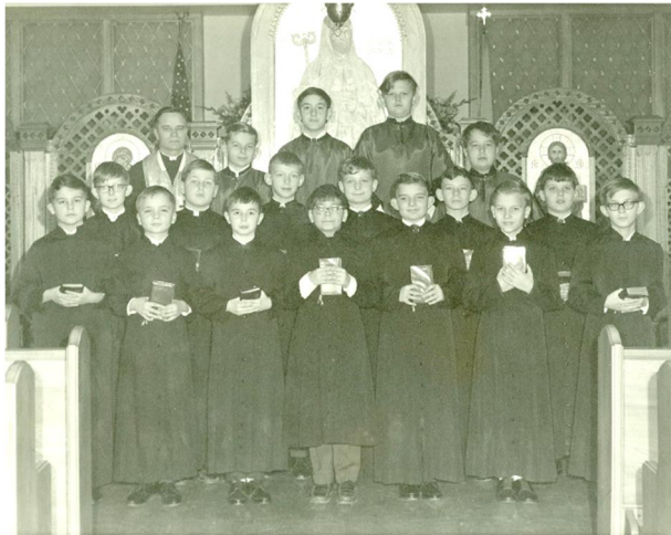
From last Bulletin: (Photo No. 33)