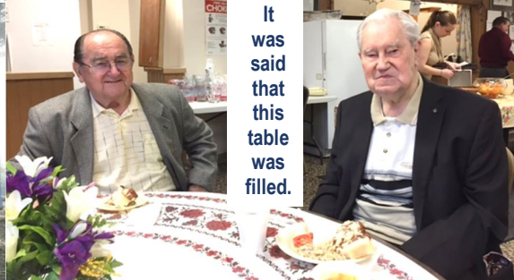
It was said that this table was filled.