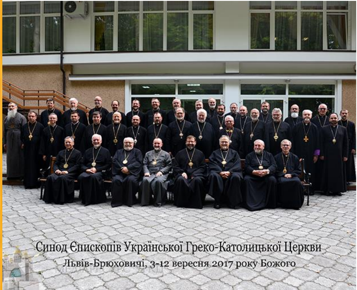
Синод Єпископів Української Греко-Католицької Церкви Львів-Брюховичі, 3-12 вересня 2017 року Божого

CHURCH BULLETIN September 24 Вересня - 2017 ЦЕРКОВНИЙ ВІСНИК