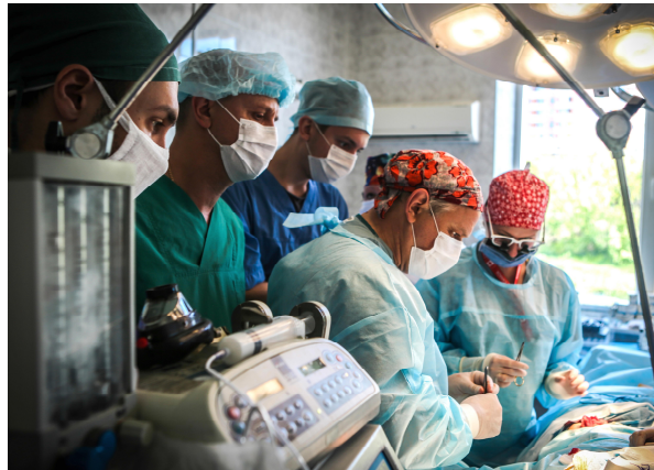
Canadian Medical Missions to Ukraine

A story about hope, resilience and compassion in a time of war