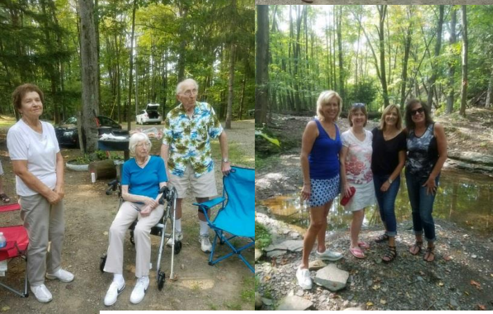
Baking potatoes at Plast Camp Novyj Sokil - Sep. 17, 2017