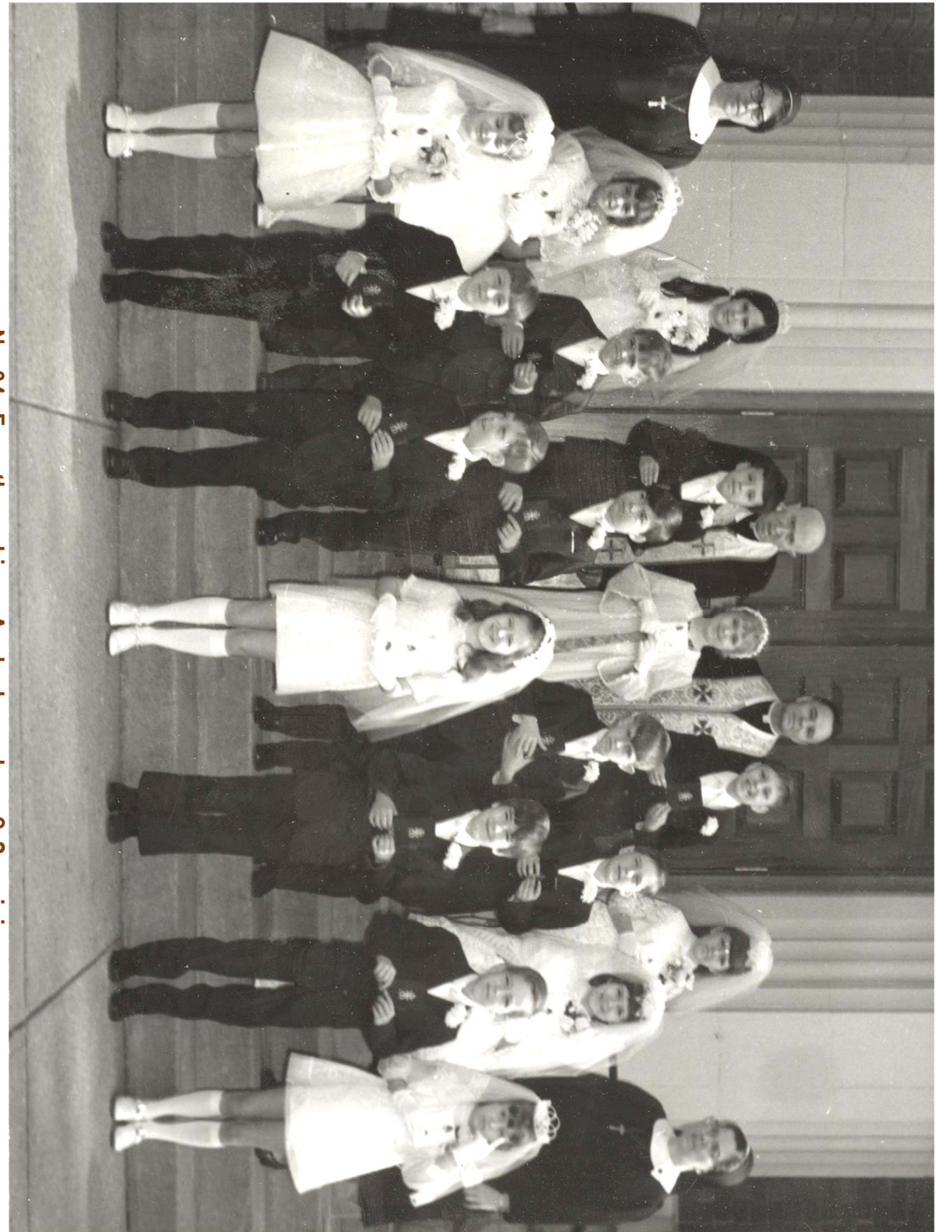
No. 34. From the archives: Anybody you know? 3 apxib.