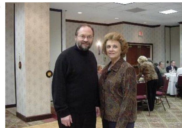
From previous LUC Conventions

Цього року плянуємо зробити книжечку з фотографіями наших парохіян, так як ми це робили попередньо. Просимо перечитати інформації по англійськи.