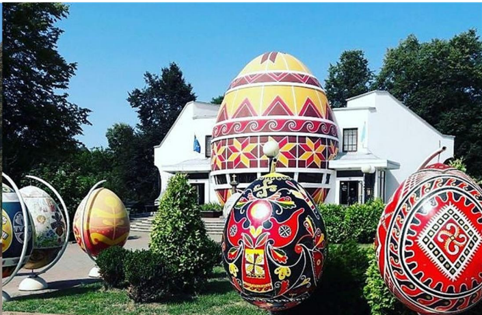
Почався Ремонт Музею «Писанка»