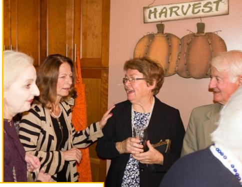
SoupFest – Borshht Mania