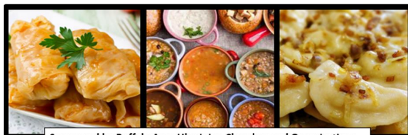
Sponsored by Buffalo Area Ukrainian Churches and Organizations

www.UkrainiansofBuffalo.com Make checks payable to: Aid for Ukraine UFCU Account # 1101037710 c/o Ukrainian Federal Credit Union 562 Genesee St. Buffalo, NY 14204 www.PayPal.com/fundraiser/charity/1438034