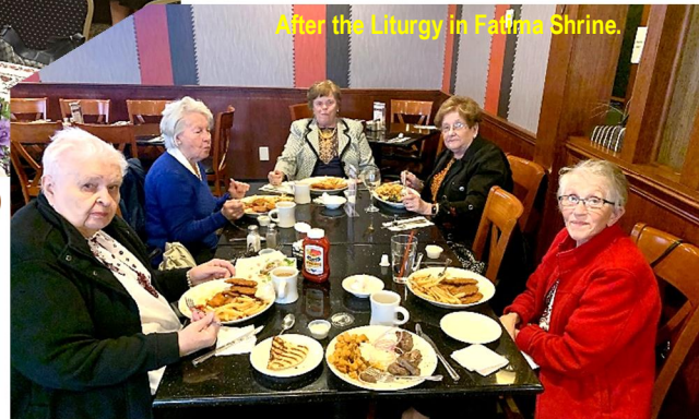
After the Liturgy in Fatima Shrine.

Дякуємо усім, що прийшли минулої неділі до Фатимського Собору на молитву. Продовжуймо молитися за мир і перемогу!