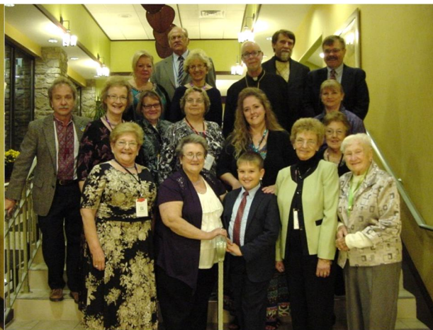
← L.U.C. Convention 2014 ~ ↑ Niagara Frontier Council