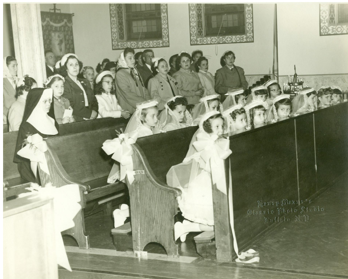
From last Bulletin: (Photo No. 41)