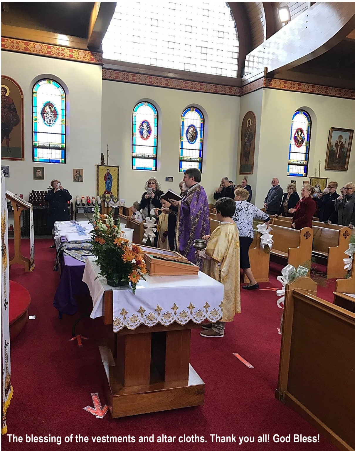
The blessing of the vestments and altar cloths. Thank you all! God Bless!