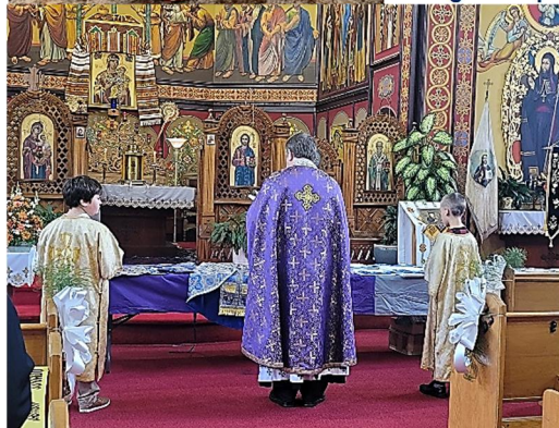
From the blessing of the vestment & altar cloths.