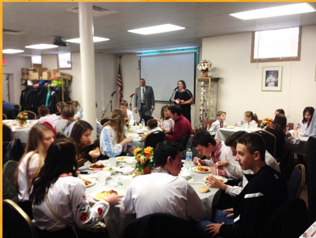
Spaghetti Dinner at Ridna Shkola, Nov. 16, '14