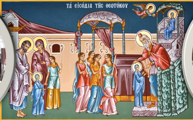
Entrance into the Temple