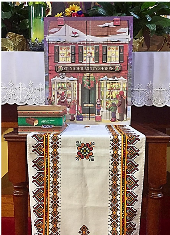
By the St. Nicholas Toy Shoppe Store