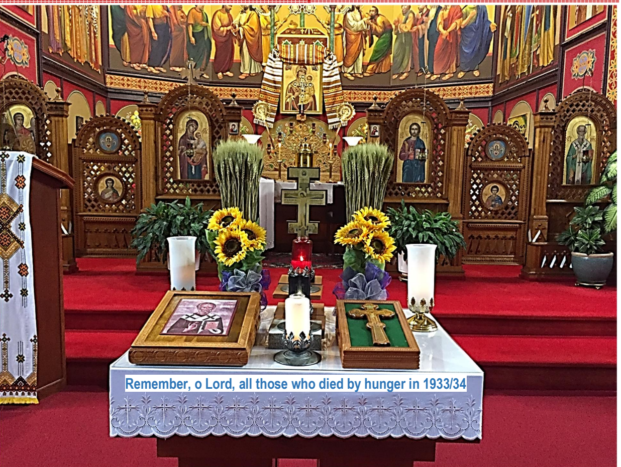
Remember, o Lord, all those who died by hunger in 1933/34

Господи Ісусе Христе, згадай усіх, що померли голодовою смертю у 1933/34 роки і не pozwоль, що б подібне коли небудь повторилося чи в нас чи де небудь у світі!!!