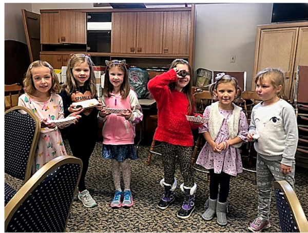
Young ladies after the Religion Class