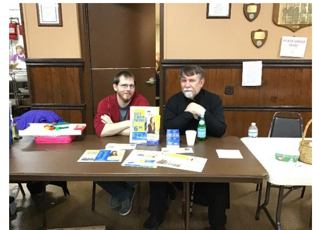
Сердечна Подяка ще раз усім, що причинился до успіху нашого цьогорічного Церквного Базару. Хай Господь усіх стократно винагородить! Thank you again to all, who took part in our Church Bazaar this year. It was one of the most successful. May the good Lord bless you abundantly!