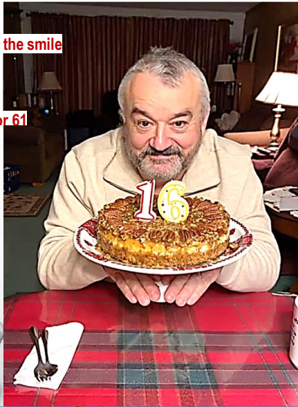
16 or 61

SAINT NICHOLAS UKRAINIAN CATHOLIC CHURCH