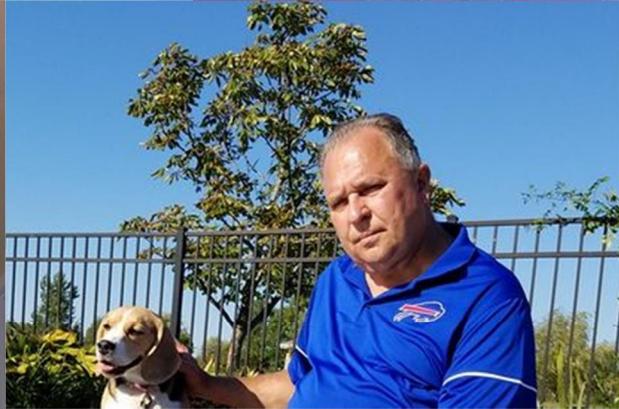
Happy Birthday to all! Многая Літа усім!