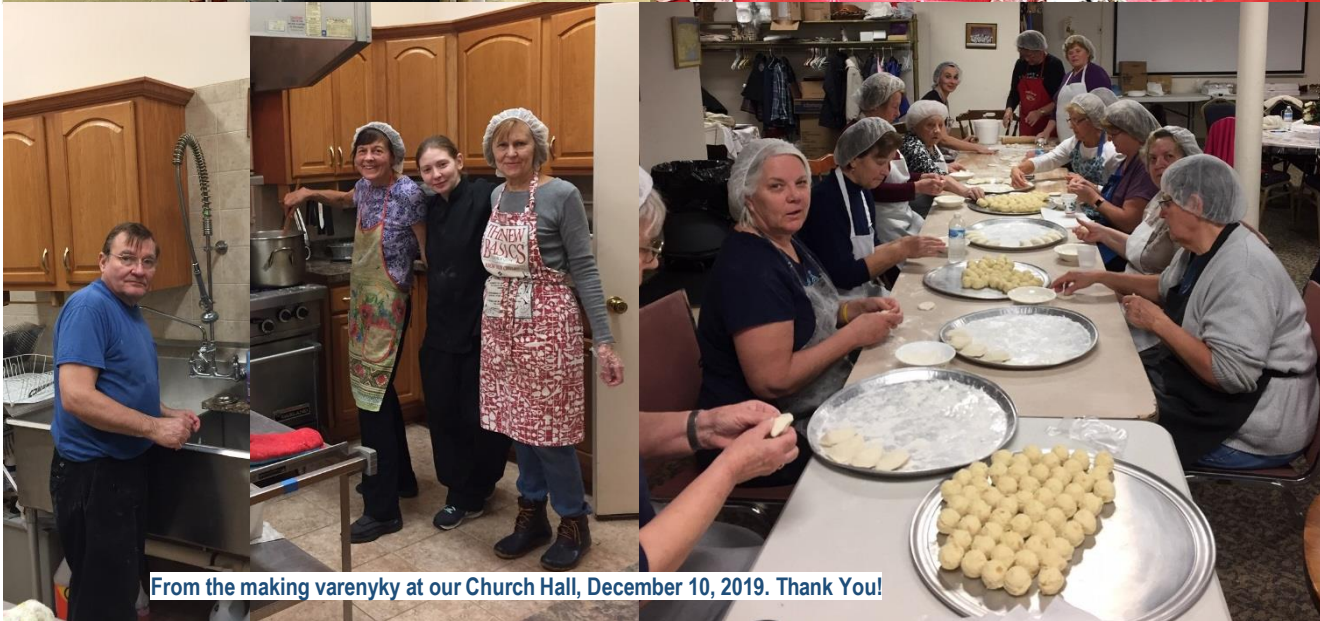
From the making varenky at our Church Hall, December 10, 2019. Thank You!