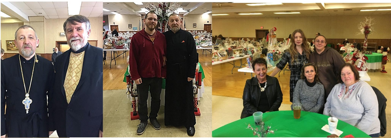
From the Ukrainian Bazaar at Holy Trinity Ukrainian Orthodox Church Hall, December 8, 2019